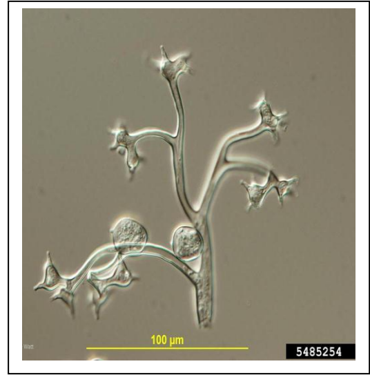
الفطر تحت المجهر