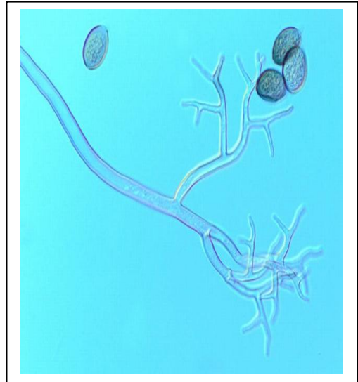
الفطر تحت المجهر